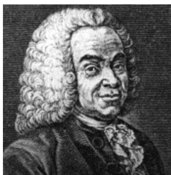
François Quesnay, 1694-1774

Médecin et économiste français (Méré 1694 - Versailles 1774), inspirateur de l'école des physiocrates. Il publia en 1758 son œuvre maîtresse, le Tableau économique , où il compare la circulation des biens et services à la circulation du sang dans le corps humain. Le Tableau est la première représentation du circuit économique, de l'interdépendance des activités économiques, des relations entre la production des biens et la répartition des revenus. Quesnay montre comment l'agriculture fournit un « produit net » qui se répartit entre les classes de la société. Pour lui, la terre est la source première de la richesse. En économie, Quesnay défend le libre jeu des lois naturelles. L'école de Lausanne, avec Walras, retrouvera plus tard l'idée d'interdépendance des activités économiques ; la comptabilité nationale et l'analyse des relations industrielles au moyen de tableaux économiques chiffrés sortiront au XXe siècle de la méthode utilisée par Quesnay. L'étude de l'équilibre des quantités globales entre groupes sociaux sera reprise à partir de 1936 par les keynésiens.